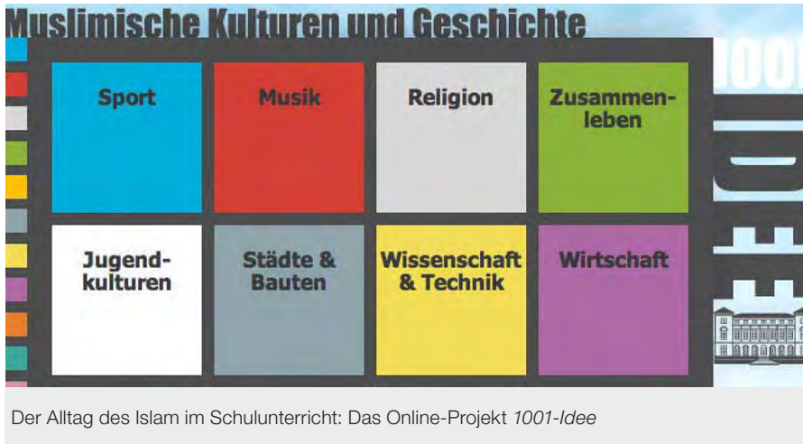
Der Alltag des Islam im Schulunterricht: Das Online-Projekt 1001-Idee

Treffen sich junge Paare in Istanbul eigentlich auch in Eiscafé? Und wie sieht es aus mit Sportvereinen in Ägypten? Die islamische Welt hat mehr zu bieten als Kopftuch und Koran. Und doch ist es bisweilen schwer, sich jenseits von Konflikten und Kriegen über den Alltag in islamischen Gesellschaften zu informieren. Das Online-Projekt 1001-Idee für den Unterricht über muslimische Kulturen und Geschichte(n) macht diesen Alltag für den Unterricht mit Schülern unterschiedlicher Altersstufen zugänglich. Fünfzehn Themenfelder werden dabei abgedeckt, neben Geschichte, Religion sowie Politik & Recht auch Film & Medien, Sport und Musik. Die Informationen können auf der Website des Projektes kostenlos heruntergeladen werden.