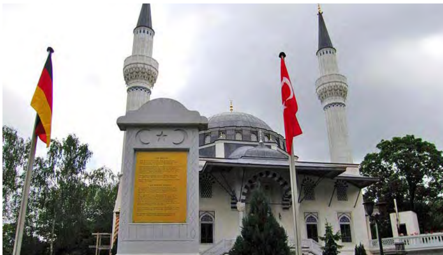
Fester Bestandteil islamischen Lebens in Berlin: Die Sehitlik-Moschee in Neukölln

Eine Dokumentation der Initiative wird demnächst erstellt. Weitere Informationen gibt Arnold Mengelkoch, Integrationsbeauftragter des Bezirks Neukölln: Tel. 030-902392951.