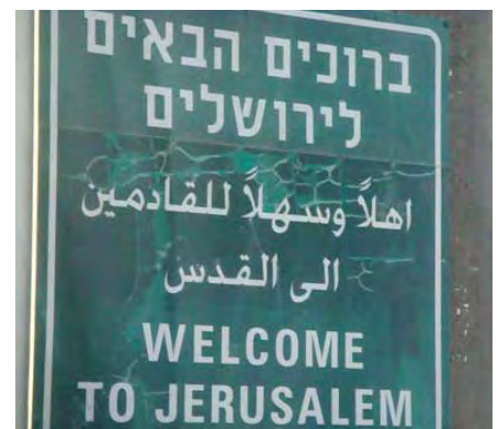
Willkommen im Heiligen Land!

gen der Jugendlichen als Muslime und Migranten ernst zu nehmen. Auf dieser Grundlage gilt es auch ihre Bereitschaft zu fördern, andere zu respektieren. „Uns war