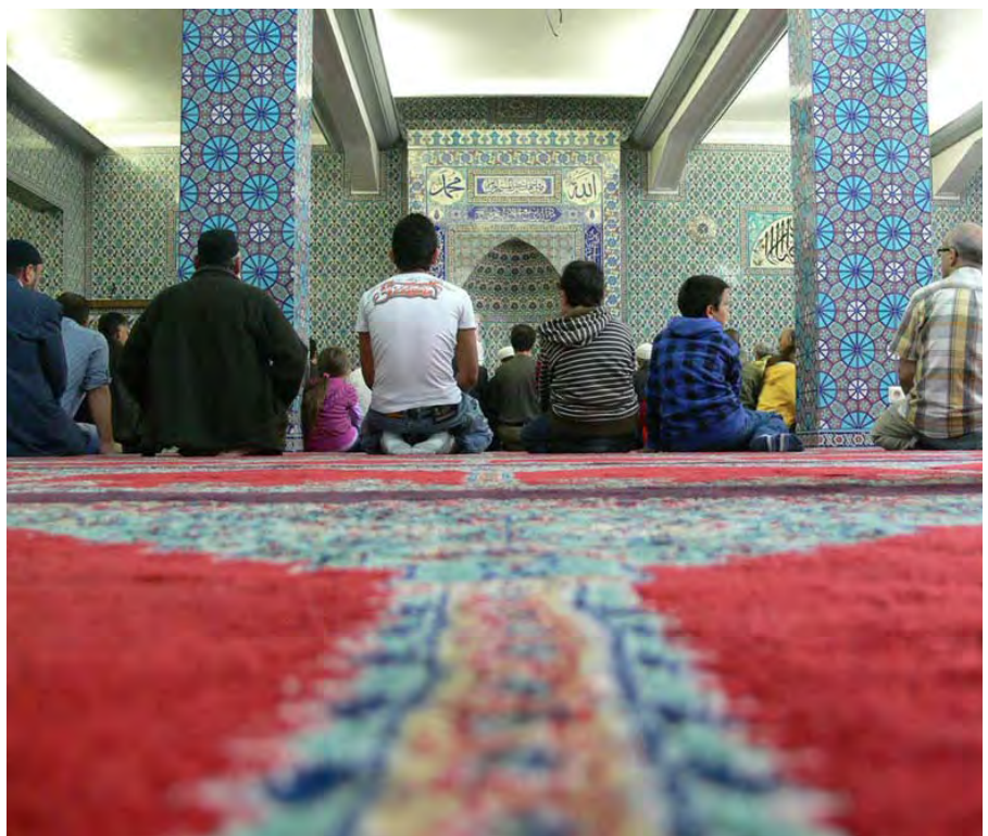
Junge Muslime beim Gebet: „Die meisten Eltern sind schon zufrieden, wenn die Kinder die rituellen Gebetsregeln erlernen.“