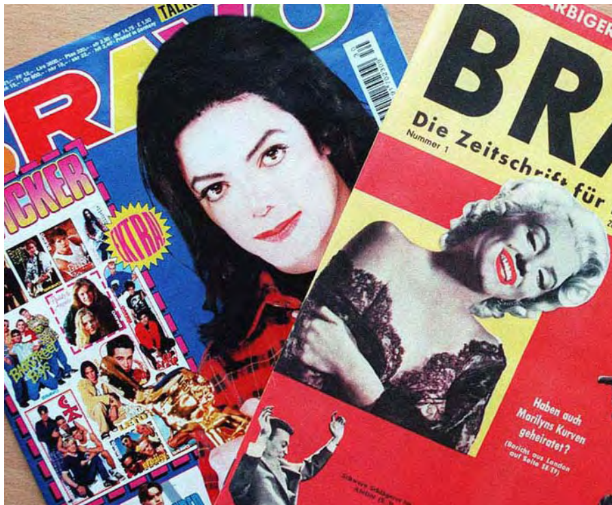
BRAVO – die größte Jugendzeitschrift im deutschsprachigen Raum. Auch jeder vierte Jugendliche mit Migrationshintergrund informiert sich hier über die Themen Sexualität und Partnerschaft.

*Quelle: Studie der Bundeszentrale für gesundheitliche Aufklärung