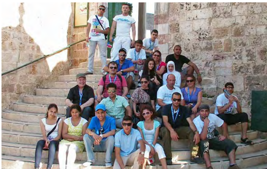
In der Altstadt von Akko: Die Neuköllner Jugendlichen im ‚Heiligen Land‘

Die Eltern wurden im Rahmen mehrerer Treffen über die Ziele, Inhalte und den Ablauf der Reise informiert. „Sie zu überzeugen, war nicht immer leicht. Der Nahostkonflikt war in den Fragen und Diskussionen sowohl vor als auch während der Reise ohnehin immer präsent“, so Kas-